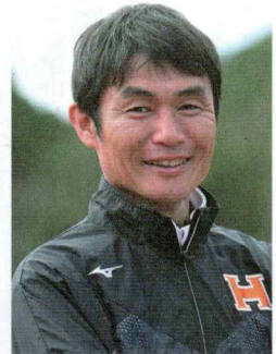
坪田監督コメント

新チームは特徴らしい特徴はなく1万mの平均タイムは低いが、箱根駅伝を戦うために1年間準備をしてきました。過去2大会安定した結果を出しています。4年生の走りが大事だと思っているので、経験豊富な4年生が4年生らしい走りをしてくれることに期待しています。